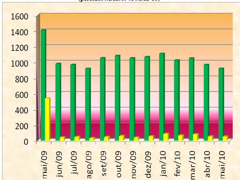
Imóveis Residenciais (período: MAI/09 A MAI/10)