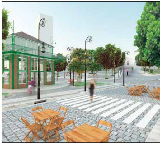
Praça Adalberto Valle será bem mais moderna

No momento, o trânsito do local, com a interdição do trecho da rua Marquês de Santa Cruz, foi desviado pelo Instituto Municipal de Engenharia e Fiscalização do Trânsito (Manaustrans) para a rua Miranda Leão, com acesso à