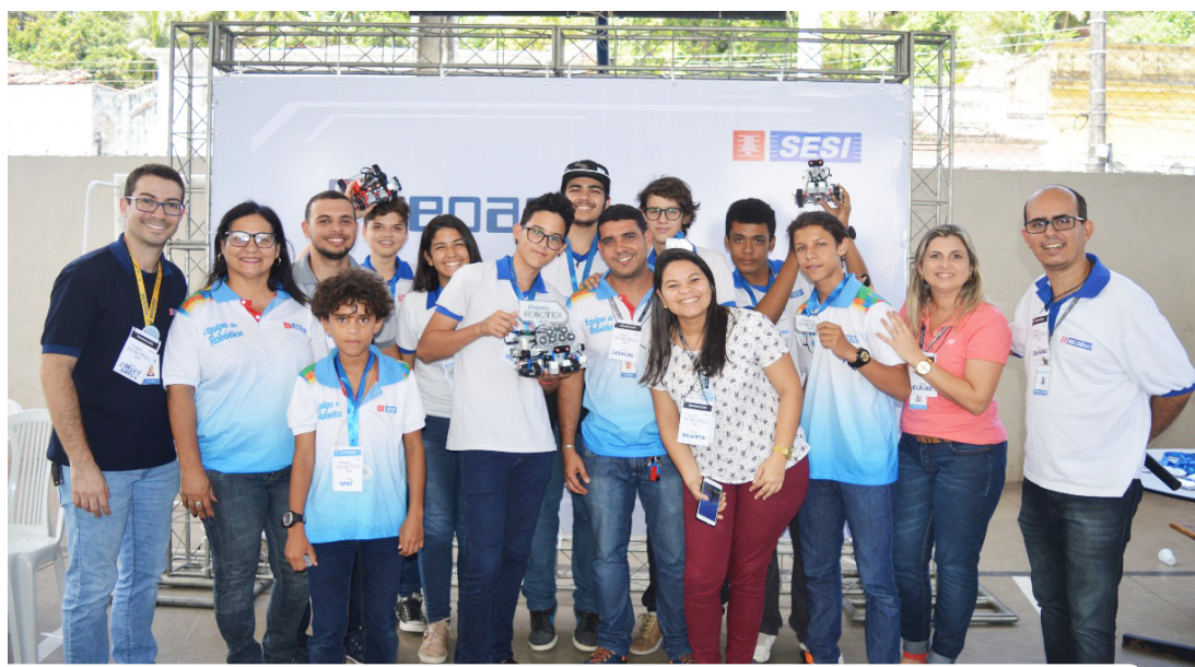
Estudantes e equipe pedagógica do Sesi vivenciaram ambiente da etapa estadual da Olimpíada Brasileira de Robótica

Na simulação, os alunos precisaram construir robôs e programá-los para que executem tarefas em um ambiente desconhecido. Na atividade, a missão era o resgate de vítimas, que deveriam ser levadas para uma área de segurança a fim de que recebessem atendimento médico. Visando à eficácia,