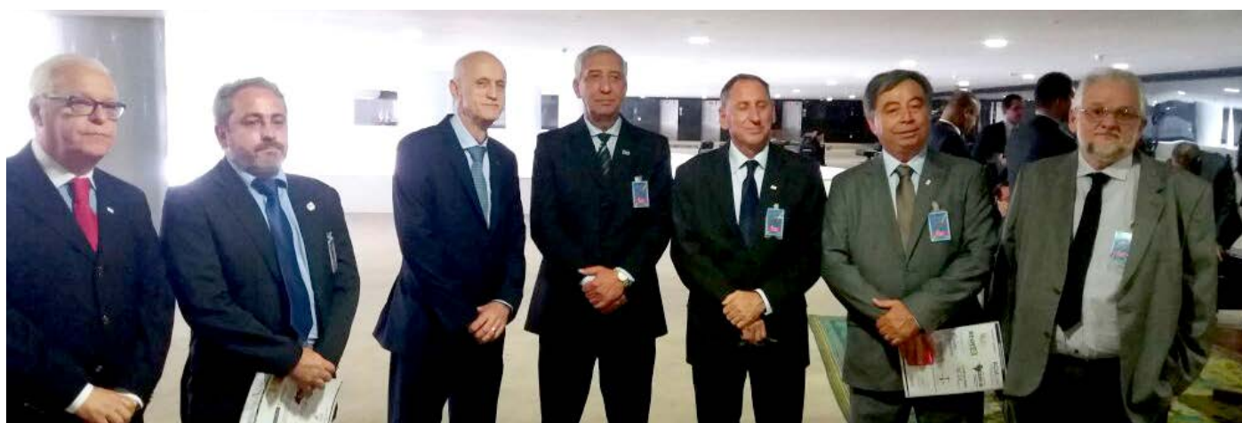
Sindicatos das Indústrias - Fieg Regional Anápolis

A ACIA pretende realizar, com data ainda a ser definida, o seminário técnico: “Polo da Base Industrial de Defesa em Anápolis”, com a presença de várias empresas que atuam neste segmento. A entidade também irá levar a proposta para uma reunião da Federação das Indústrias do Estado de São Paulo (Fiesp).