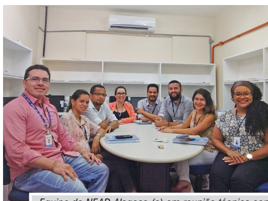
Equipe do NEAD Alagoas (e) em reunião técnica com o Departamento Nacional para formação de novas turmas