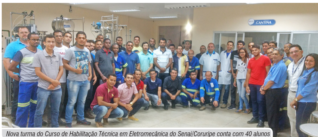
Nova turma do Curso de Habilitação Técnica em Eletromecânica do Senai/Coruripe conta com 40 alunos

Foram contratadas, inicialmente, duas turmas de 40 alunos especialistas de todos os 27 departamentos regionais do país,