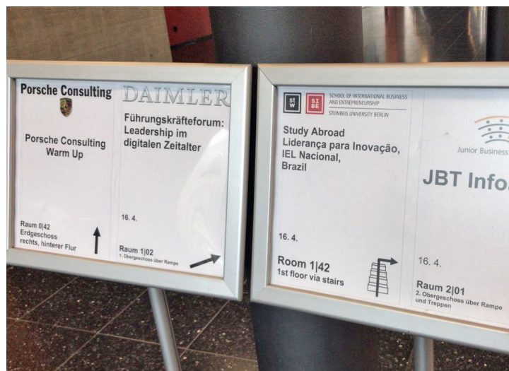
Alagoanos estão concentrados em Stuttgart, no estado de Baden-Württemberg