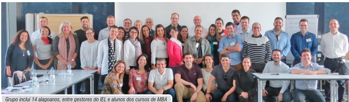
Grupo inclui 14 alagoanos, entre gestores do IEL e alunos dos cursos de MBA