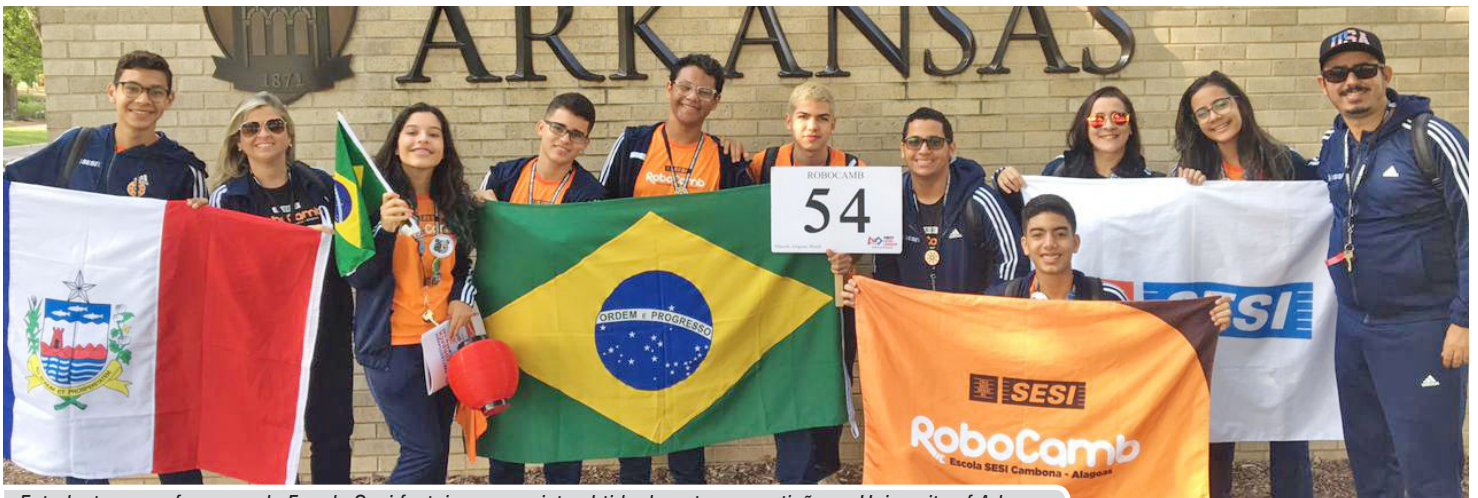
Estudantes e professores da Escola Sesi festejam conquista obtida durante competição na University of Arkansas