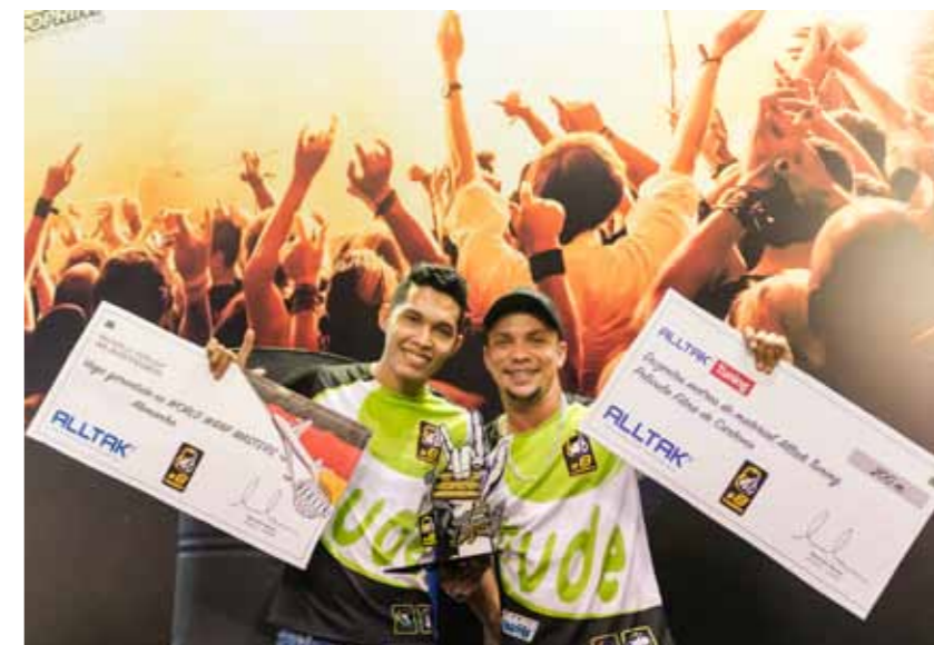
A equipe WS Adesivação, vencedora do CAMBEA #8

A Zênite Sistemas, especialista em softwares gerenciais, com foco na in-