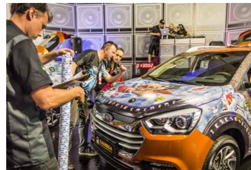
Campeonato de Envelopamento Automotivo #CAMBEA8

dústria gráfica esteve presente na feira. Inclusive, nova atualização do sistema já foi aderida por grupo de Indústrias Gráficas do Rio Grande do Norte que participam do Singraf-RN, mostrando facilidade e inovação, pontos importantes da feira.