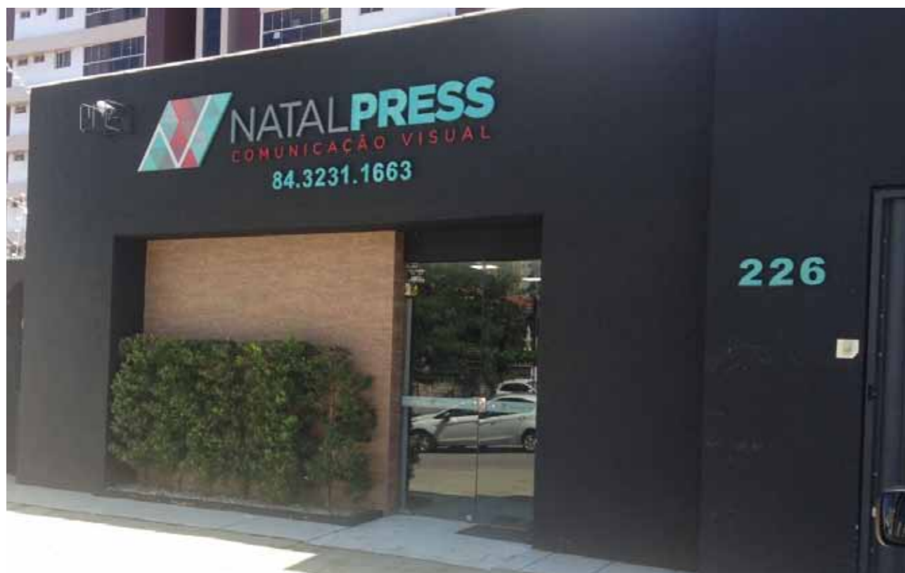
Empresa Natal Press - Comunicação Visual, situada no bairro Tirol, em Natal/RN