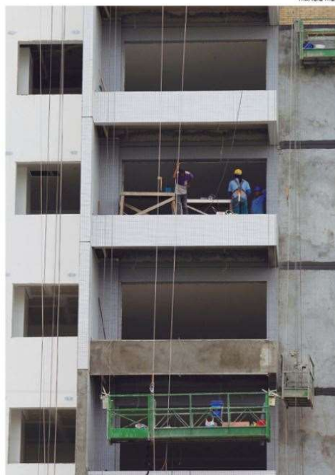
O setor, segundo a FCV, obteve a quarta alta consecutiva nos indicadores trimestrais

O Nível de Utilização da Capacidade do setor avançou 1,9 ponto percentual, para 66,6%. Os indicadores desagregados dos Núcis para Mão de Obra e Máquinas e Equipamentos também tiveram variações positivas: 2,0 e 1,2 pontos.