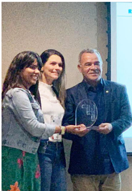
Fiea foi premiada durante encontro na sede da CNI, em Brasília

Ele atribui o resultado ao apoio da Presidência da Federação das Indústrias de Alagoas e, ainda, ao empenho da sua equipe. “O que é passado pela Presidência da Federação para a Unidade Sindical é que devemos dar total apoio aos sindicatos. É isso que procuramos fazer, na medida do possível. Eu