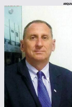
Anastacios Apostolos Dagios Presidente

Isso é imprescindível para que possamos voltar ao crescimento desejado em nosso município, com retorno das condições de atuação ampla do setor produtivo.