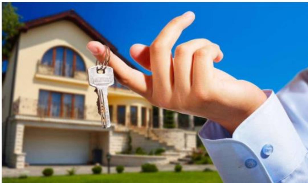
Os preços de estoque das incorporadores e construtoras vão ficar mais atrativos

Em meio a expectativas parecidas, o Sindicato das Indústrias da Construção Civil em Manaus (Sinducon) afirmou que o consumidor amazonense neste mercado deve se comportar nos mesmos índices de antes da medida.