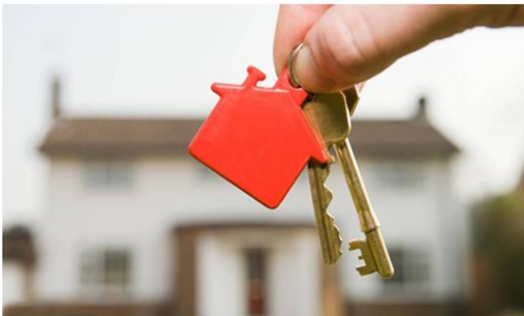
É possível que haja mais aceitação nos novos lançamentos do setor | Foto: Divulgação

"Estamos vivendo momentos específicos na economia atual como o aumento constante do dólar, da inflação e do reajuste da mão-de-obra. Por causa destas mudanças, sim, o preço dos novos imóveis deve aumentar.