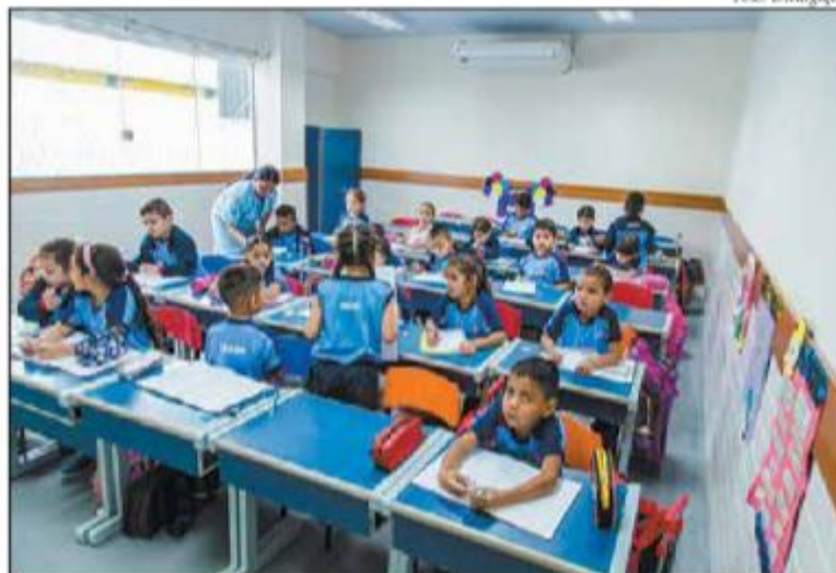
Escola do Sesi em Iranduba, apoio a inclusão social