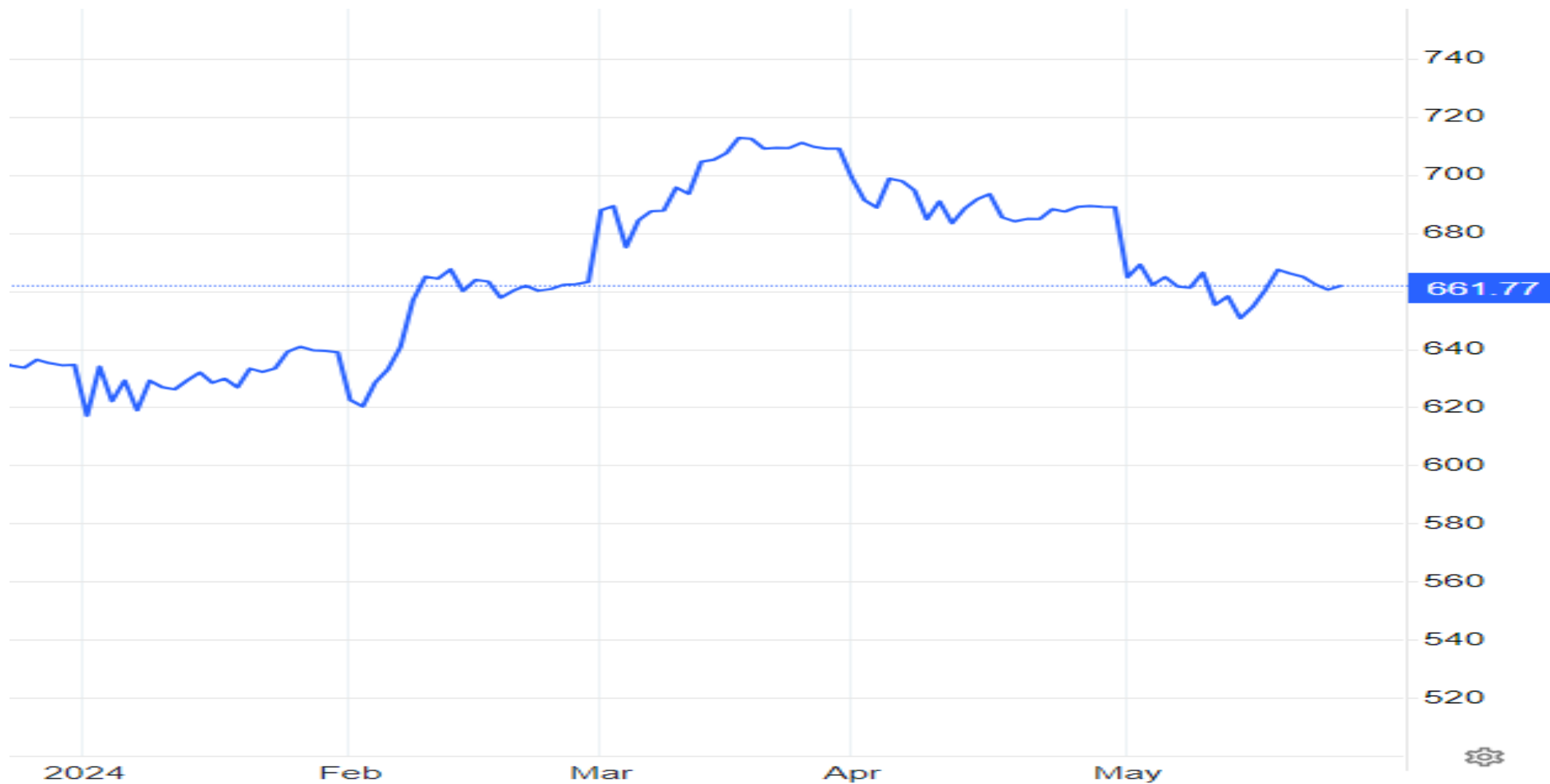
Preços USD / tonelada